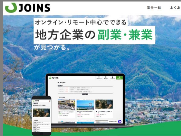
▲三原市の事業者展開中