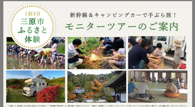
▲三原市高坂地区にて計画中