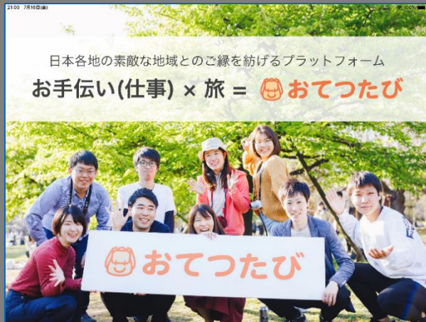
▲今年3月に竹原で実施、今後展開予定