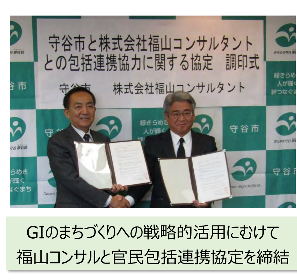
GIのまちづくりへの戦略的活用に向けて福山コンサルと官民包括連携協定を締結